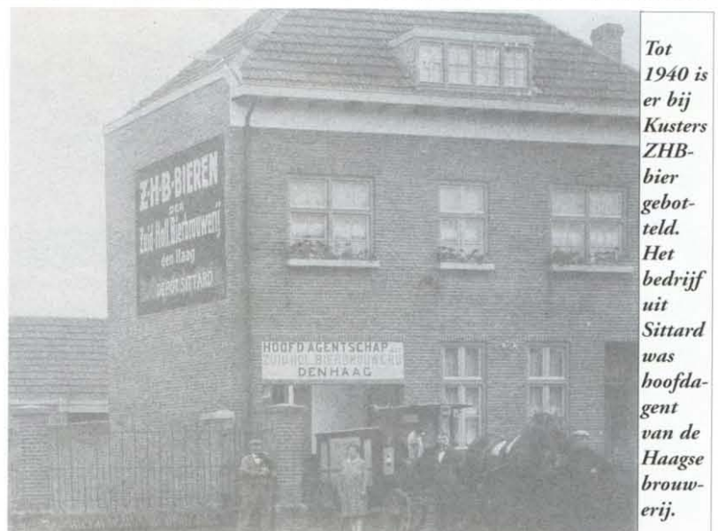
Tot 1940 is er bij Kusters ZHB-bier gebotteld. Het bedrijf uit Sittard was hoofdagent van de Haagse brouwerij.