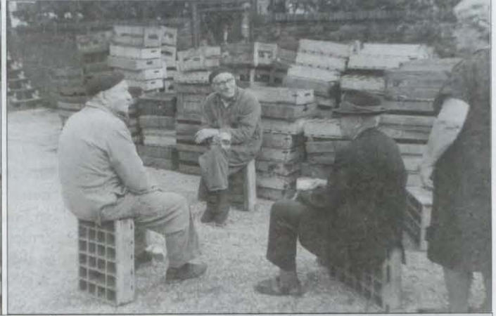
Honderden kratten gingen in vlammen op en flessen werden eveneens vernietigd.

ger jaren sterk terug en voor de kleine fabriekjes werd het moeilijk om hun producten te slijten. Kusters besloot in het voorjaar van 1969 om te stoppen en zich te richten op de levering van dranken aan onder andere ziekenhuizen, bejaardencen-