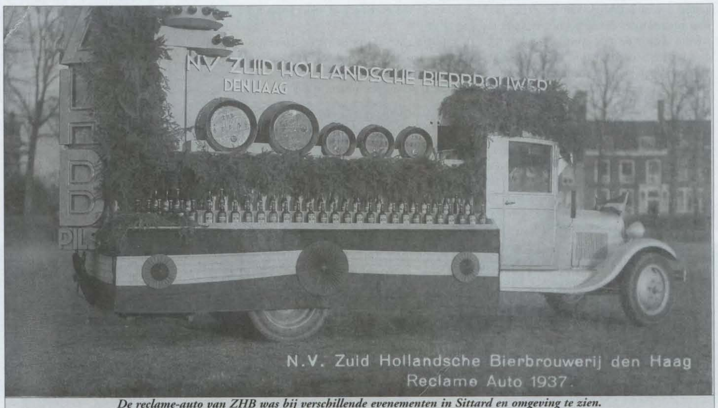
N.V. Zuid Hollandsche Bierbrouwerij den Haag Reclame Auto 1937.

kan bij mij worden aangevraagd: Kees van Kuilenburg, 5 Meistraat 19, 2396 ED, Koudekerk aan de Rijn. Uiteraard een gefrankeerde antwoorder velop bijsluiten.